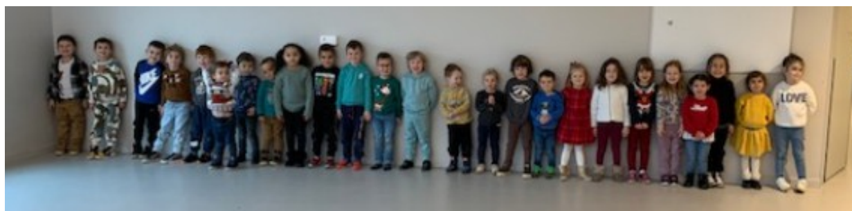
Maternelle 3 Classe de Madame MAIRE