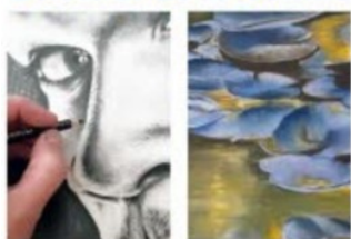
L'Atelier de la Colline

Tels, notamment, des travaux de servigiennes.