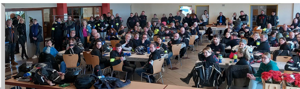
Ici lors du rappel des mesures de sécurité tant pour les déplacements que lors des arrêts