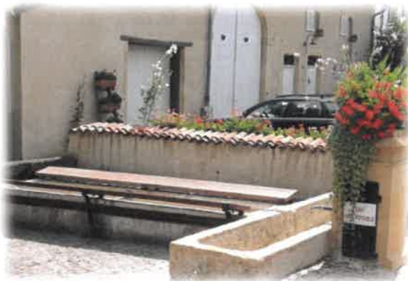
Le lavoir et la fontaine (vides en période de canicule)