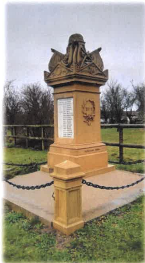
Le mémorial allemand de la guerre de 1870