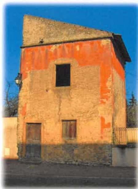
L'ancienne maison forte et ses dépendances – on y voit actuellement « la Suzette »