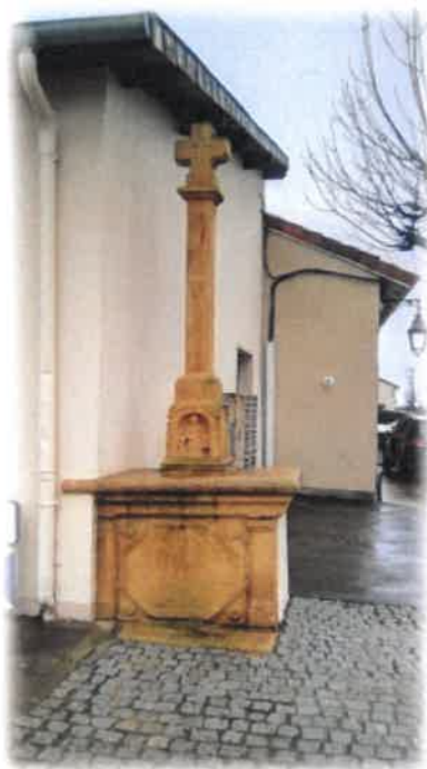
Les calvaires en pierre