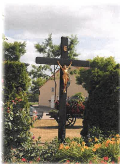
La croix en bois